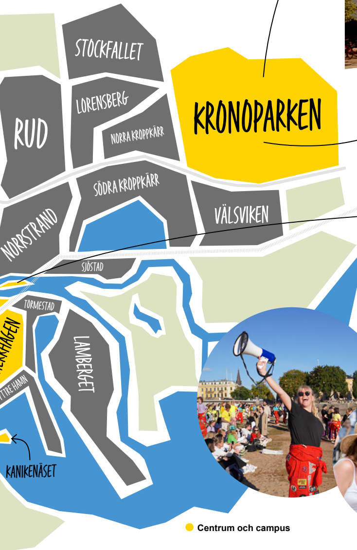
● Centrum och campus